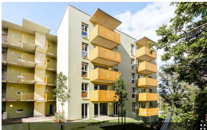
Generationenwohnhaus Lebensraum Lend

Silver Living übergab gemeinsam mit dem Vertriebspartner bei Bauherrenmodellen, der ÖKO-Wohnbau, sowie dem Mieter für die Betreuten Wohnungen, Caritas Steiermark, das Generationenwohnhaus "Lebensraum Lend" an die Eigentümer. Die Anlage umfasst 73 Wohnungen mit Größen von ca. 40 - 70 m 2 für Familien, Singles, junge Pärchen und auch ältere Menschen.